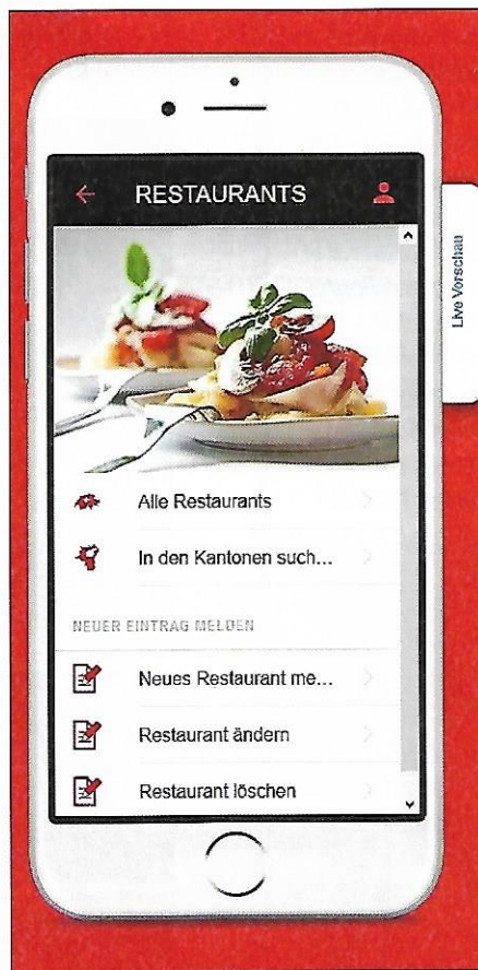
Von dieser Seite aus findet man das passende Restaurant.