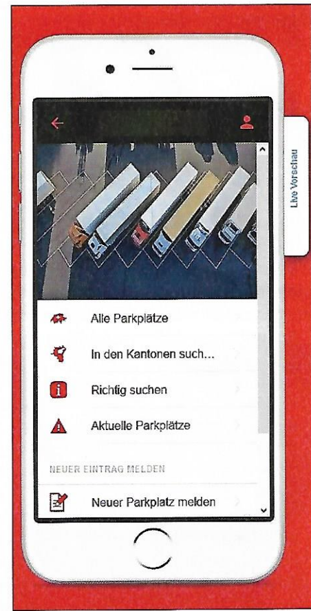
Dieses Menu zeigt die Parkplätze, auf denen Anhänger geparkt werden können.